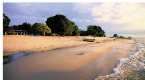
Strand von Chintheche